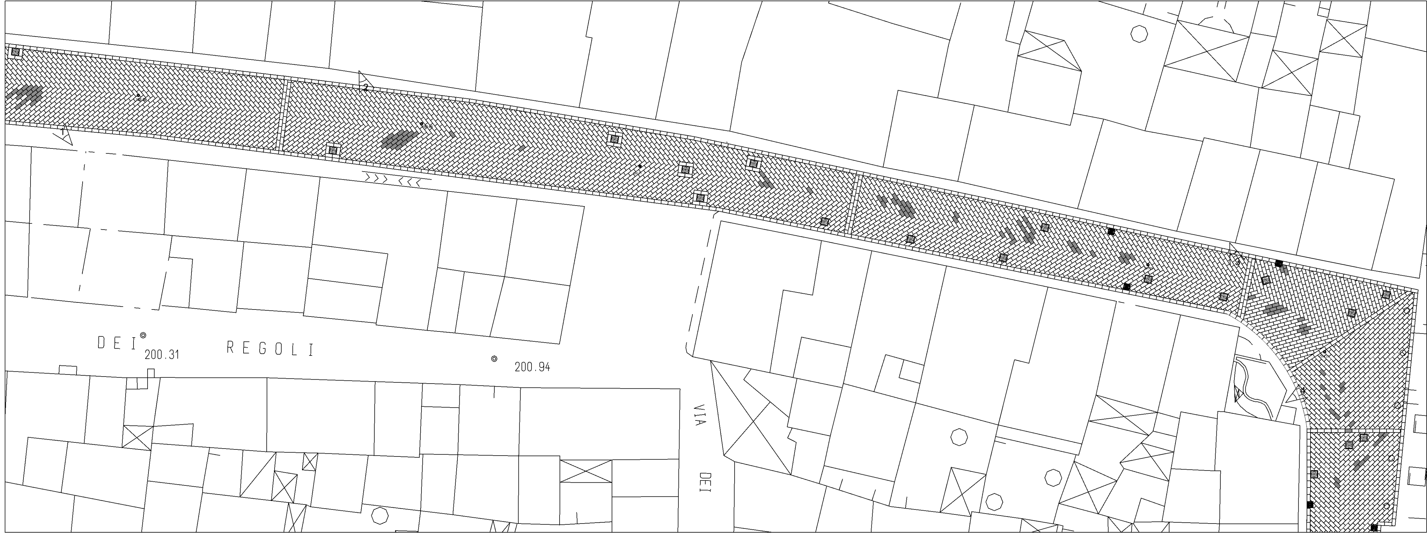
Particolari di dettaglio progetto anno 2005