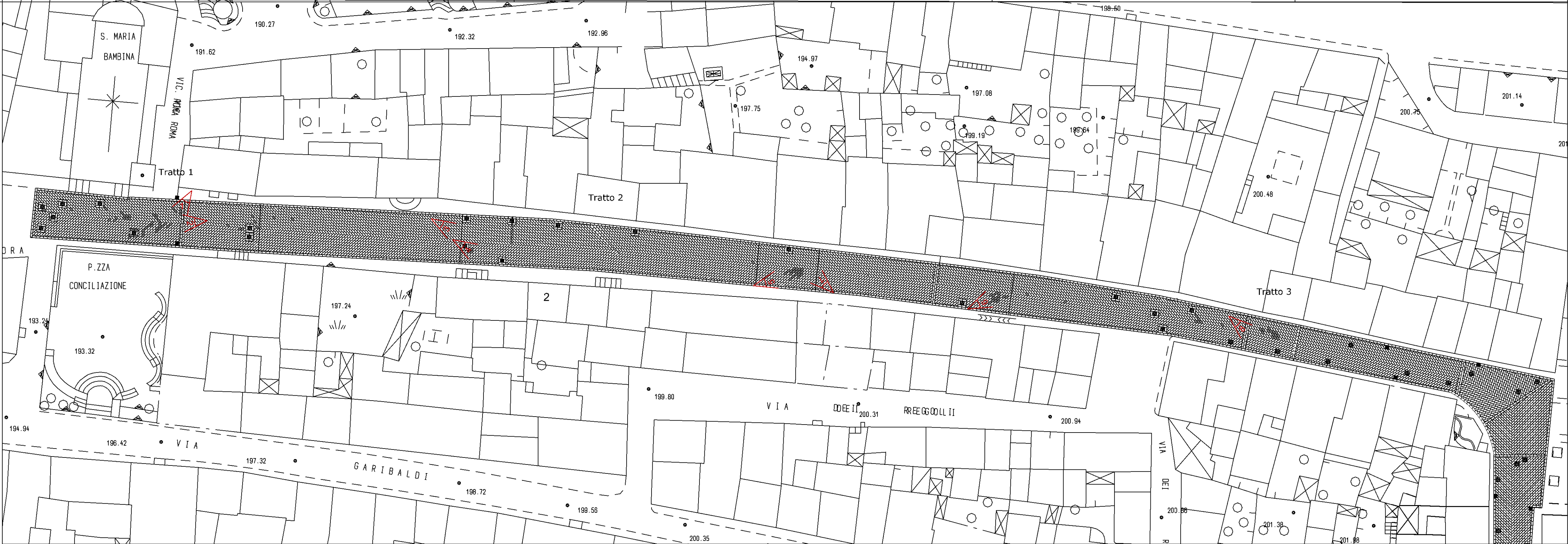
Planimetria Via Roma_Primo-Secondo tratto scala 1.200